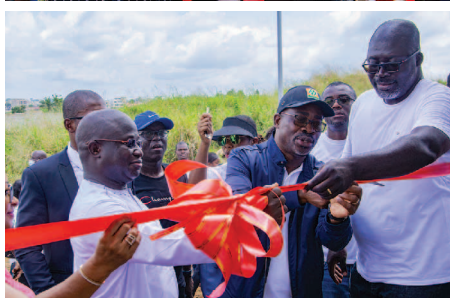
Coupure de ruban par le PCA de PETROCI la PCA de G2I et le DG de PETROCI

Pictures of ribbon cutting and handing over of keys