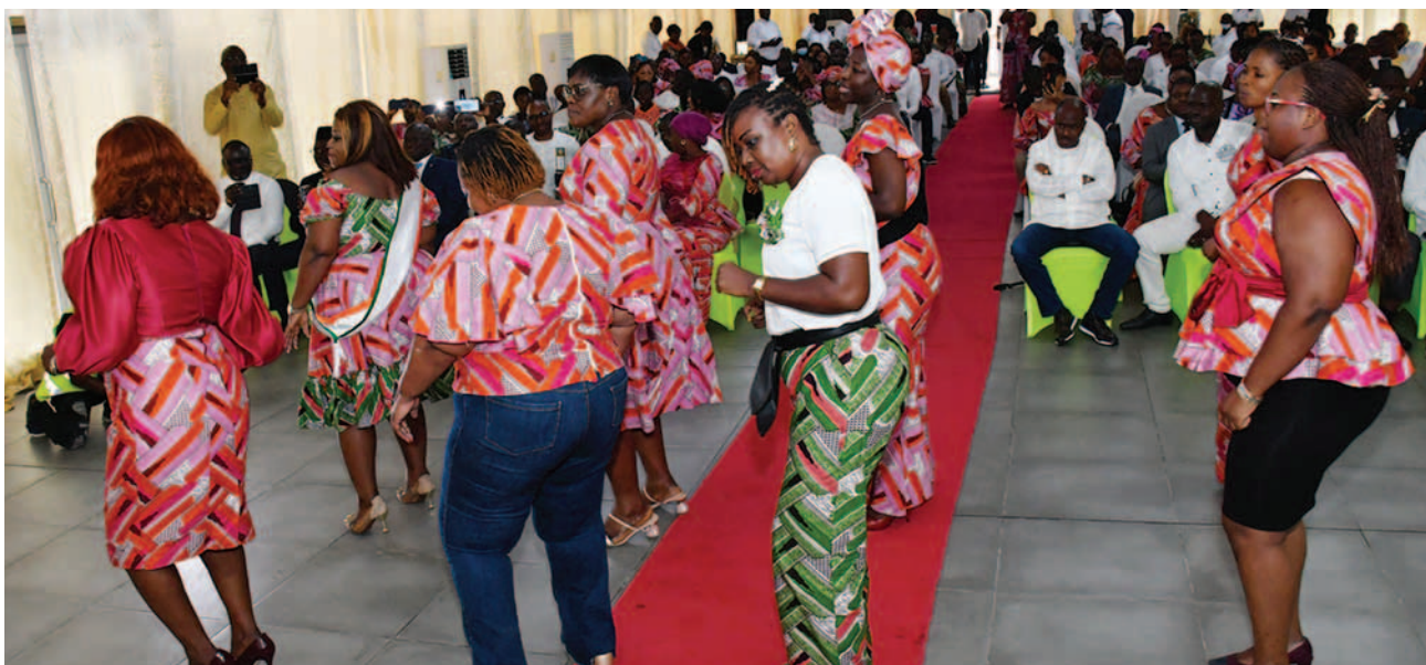
Le ballet des femmes de PETROCI The PETROCI women's ballet