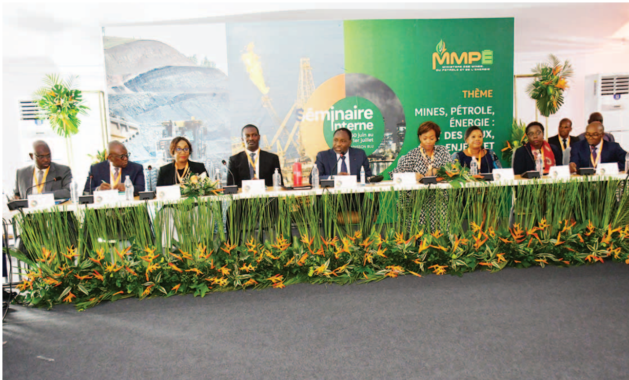
Le ministre, les membres de son cabinet et les directeurs généraux des Hydrocarbures et de l'Énergie

The Minister, members of his cabinet and the Directors General of Hydrocarbons and Energy