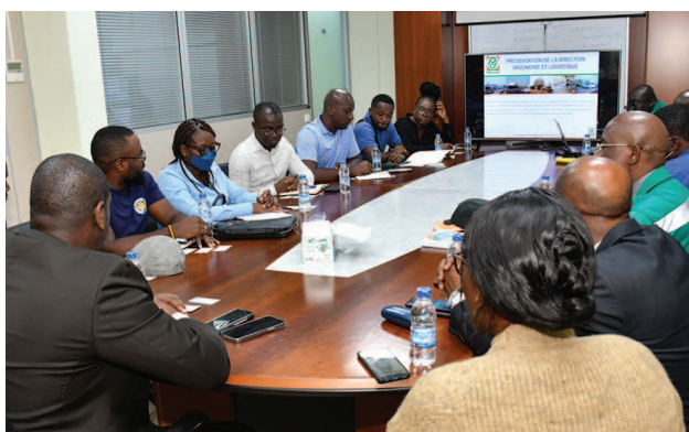
Séance de travail de Petroci avec la délégation ghanéenne Working session of PETROCI with Ghanaian delegation

Une délégation de l'Autorité Nationale du Pétrole du Ghana a séjourné à Abidjan du 23 au 25 mai 2022 pour une visite de travail.