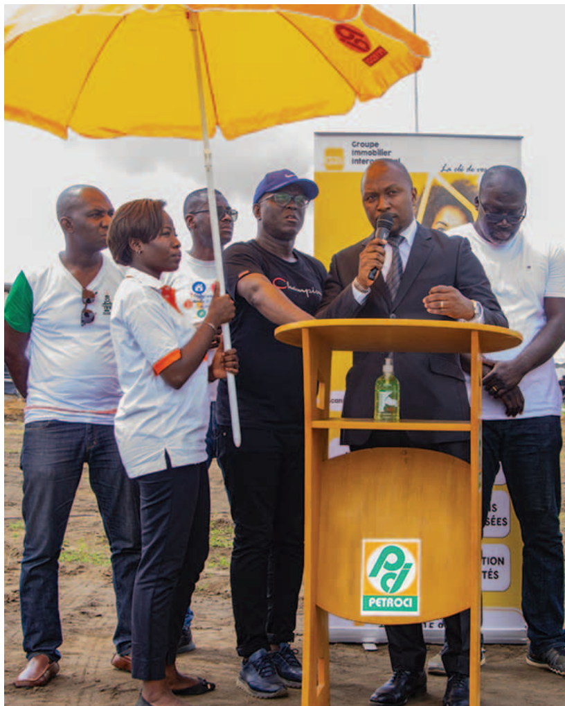
Allocution du PCA de la MAP Famoussa Traoré

Speech by Famoussa Traoré, CEO of PETROCI workers' Mutual