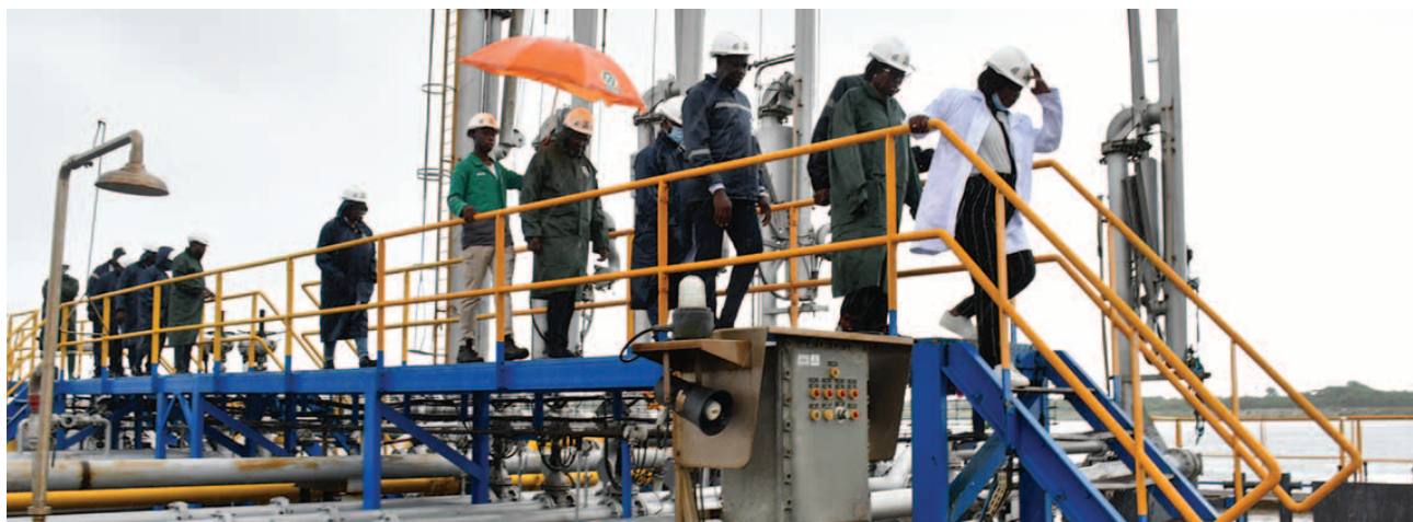
Visite des installations des appontements de PETROCI Visit of PETROCI's wharf facilities