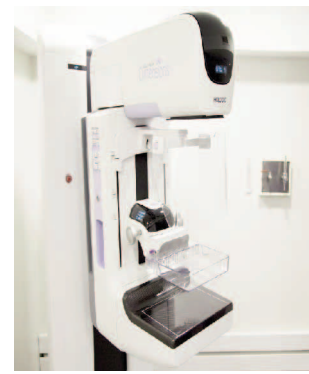
L'équipement de mammographie Mammography equipment