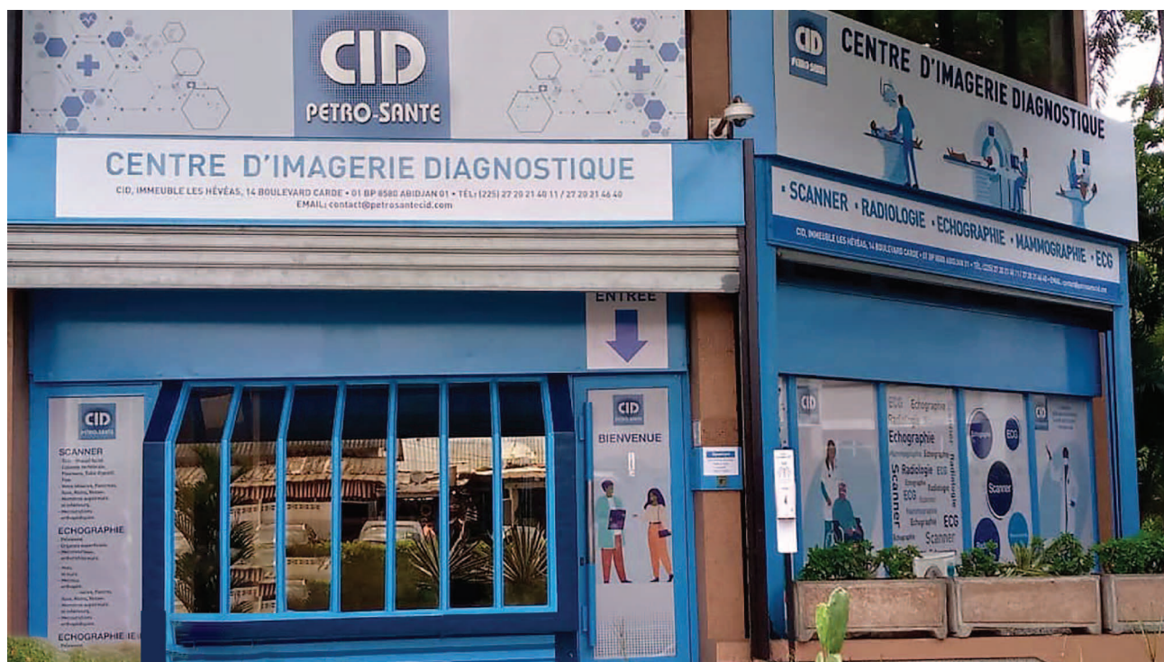
Le nouveau visage de PETRO SANTE après le rebranding

Sans conteste, PETRO SANTE amorce depuis peu une nouvelle ère de son existence. Le Centre d'Imagerie Diagnostique (CID) fait peau neuve. Et ce, pour le bien-être du personnel de Petroci Holding et du public externe. Etat des lieux !