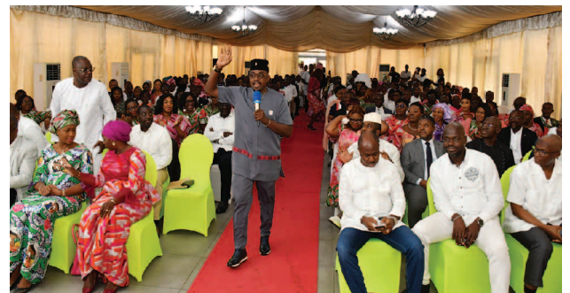
Prestation de l'humoriste En K 2 K Performance of the comedian En K 2 K

Retour en images sur cette mémorable cérémonie.