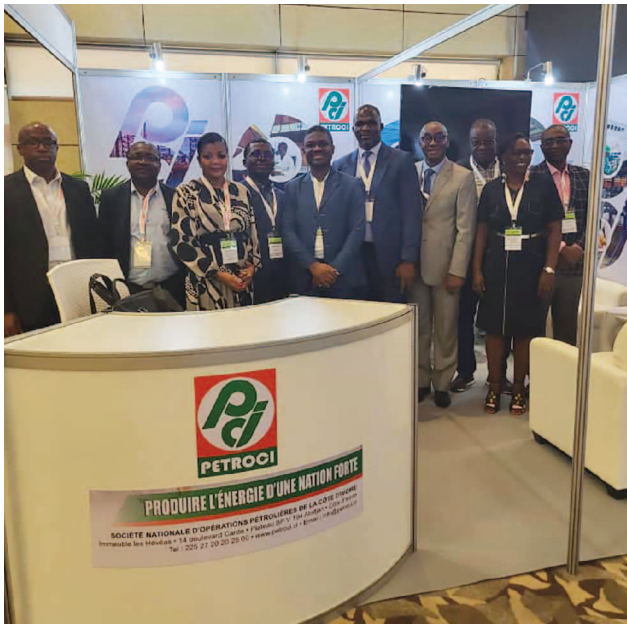
La délégation ivoirienne sur le stand de PETROCI

La 8 ème édition du Congrès de l'Organisation des Producteurs de Pétrole Africains (APPO), s'est tenue du 16 au 19 mai 2022 à CAPE VIII à Luanda en Angola sur le thème de la « Transition énergétique et l'avenir de l'industrie pétrolière et gazière en Afrique : opportunités, défis et développement ». Petroci Holding a tenu sa place à cette tribune africaine des producteurs du pétrole.