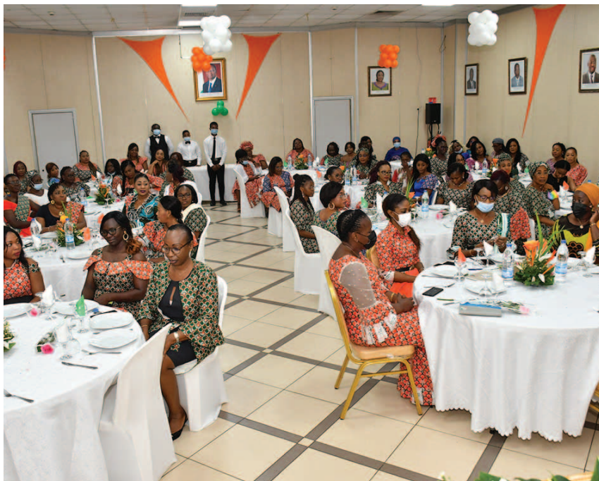
Les participantes à la cérémonie The participants in the ceremony

Au menu de cette célébration, plusieurs temps forts :