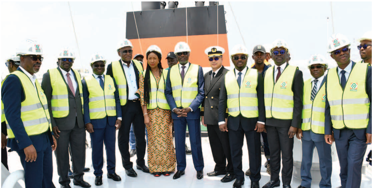
Photo de famille sur le SAPET GAS

Retenons que le navire SAPET GAS contribuera à améliorer l'approvisionnement, la disponibilité et la distribution du butane en Côte d'Ivoire. Cette contribution permettra de stimuler le développement économique et de préserver le bien-être de plus de 28 millions d'Ivoiriens mais également de plus de 50 millions de personnes dans les pays voisins.