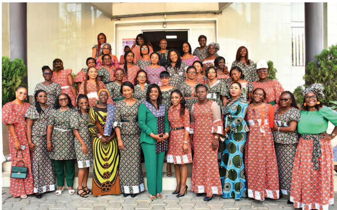
Photo de famille Family photo