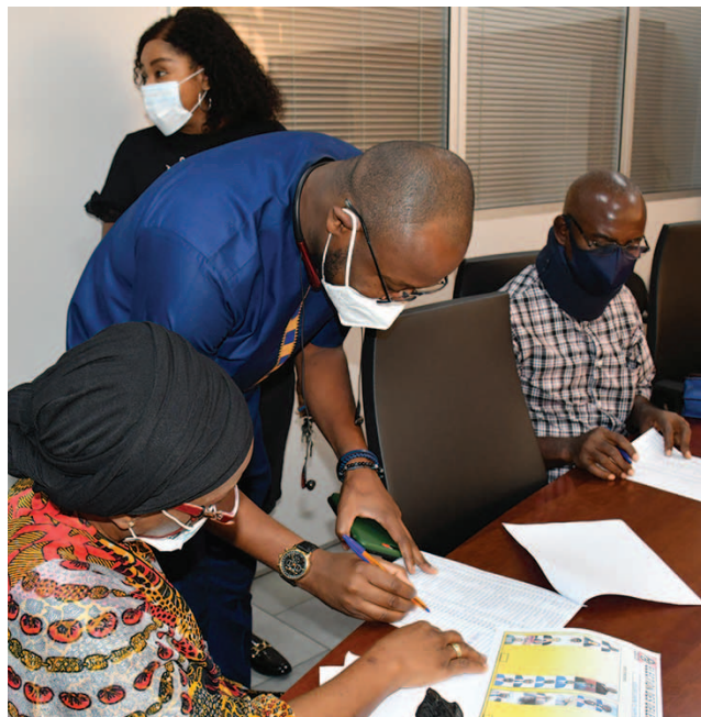
Un votant de PETROCI émergeant sur la liste du personnel

Les prochaines élections se tiendront donc en 2024.