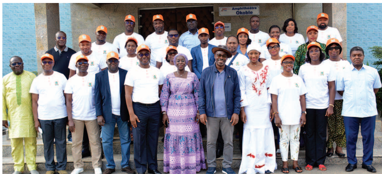
Photo du PCA et de la DGA AFAC avec les participants au séminaire

Compilation session of the works of the seminar