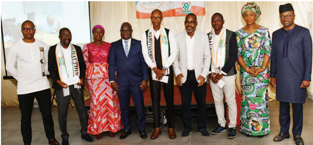
L'Ambassadeur PETROCI et ses dauphins encadrés par le management de PETROCI et le président de la mutuelle des agents de PETROCI The PETROCI ambassador and her runners-up surrounded by PETROCI management and the president of the PETROCI Staff Mutual