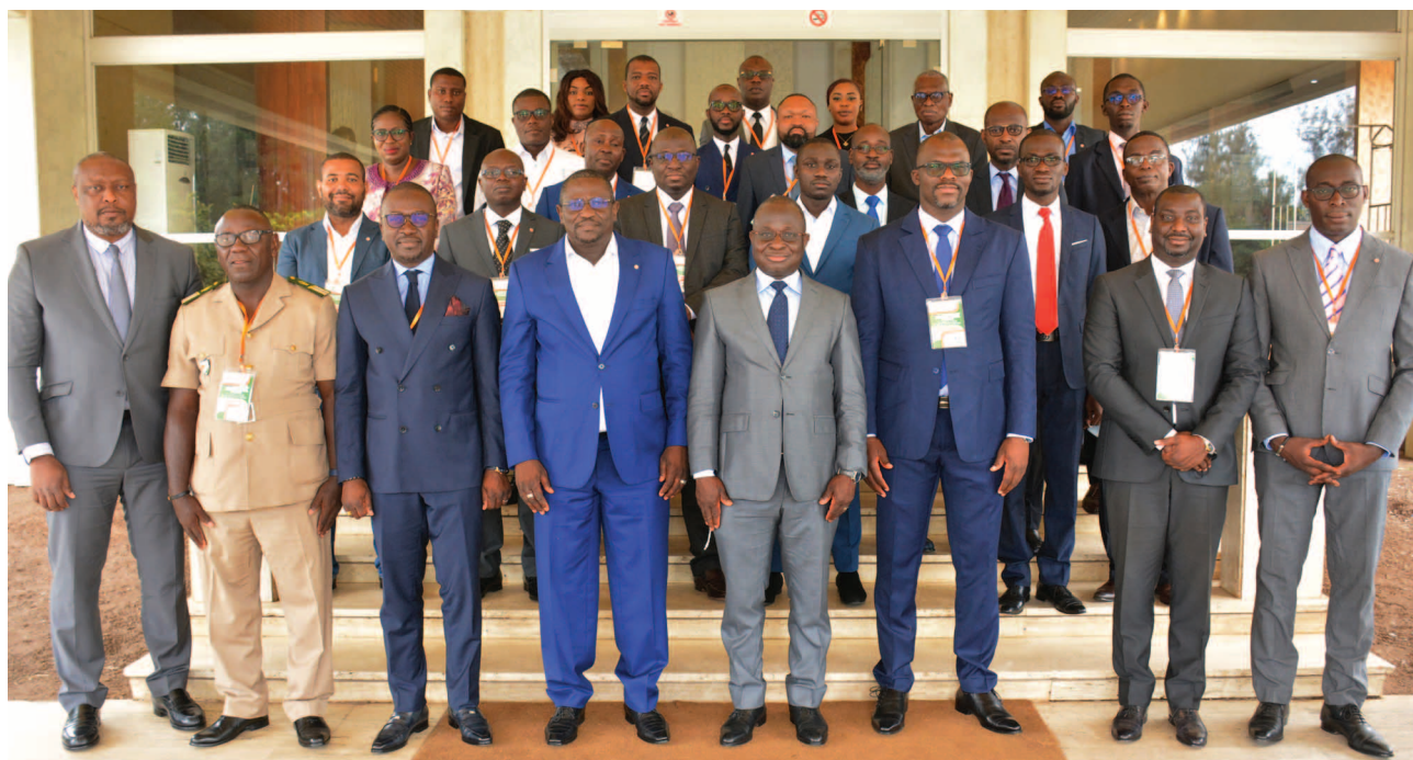
Photo de famille des participants au séminaire