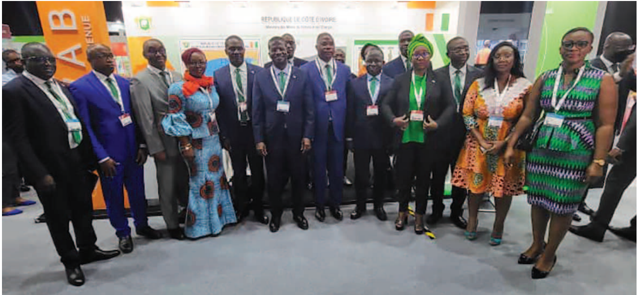
Photo de famille de la délégation ivoirienne du MMPE