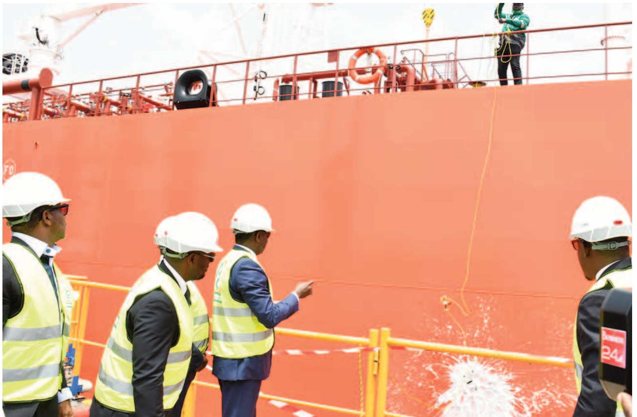
Baptême du MT SAPET GAS par le ministre Sangafowa Coulibaly

Née du partenariat PETROCI et SAHARA ENERGY, la société SAPET ENERGY a, dans le cadre de sa mission de contribution à la politique de butanisation de la Côte d'Ivoire, réceptionné son tout premier butanier dénommé GPL MT SAPET GAS.