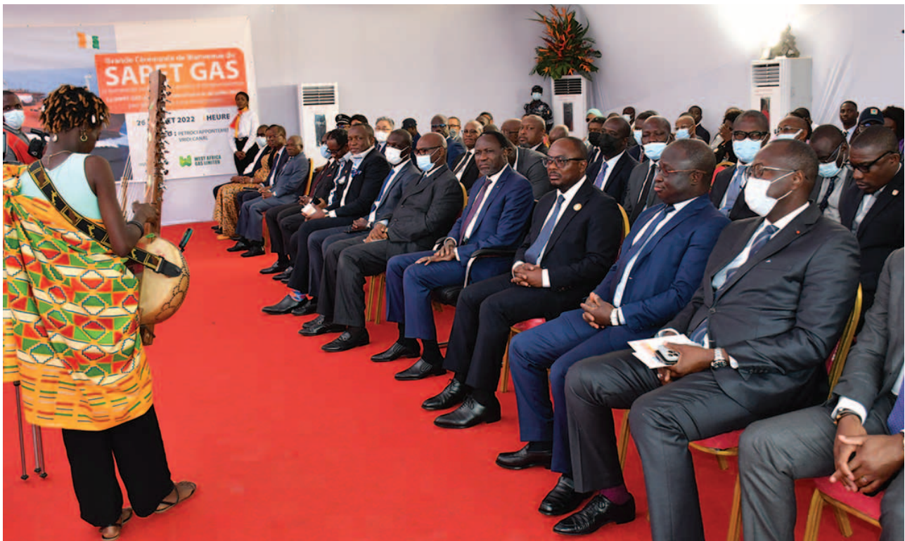
Les participants à la cérémonie