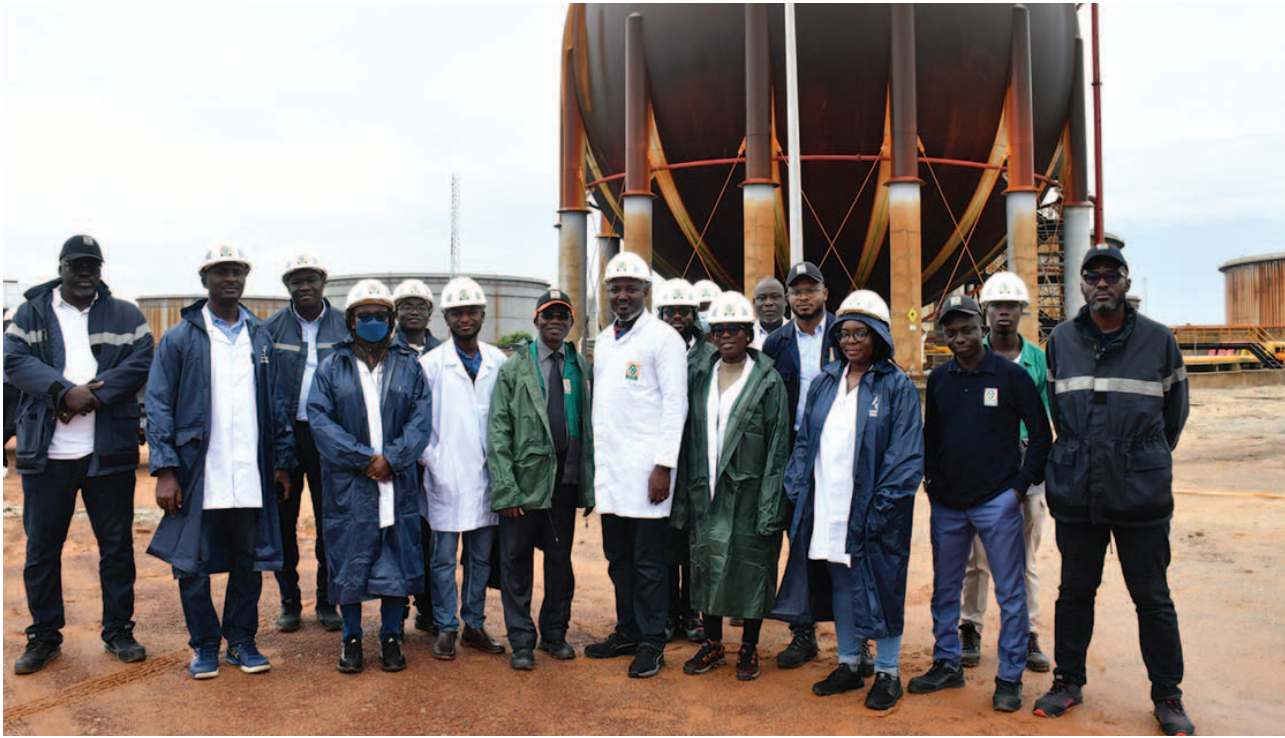
Visite des sphères de stockage de gaz butane