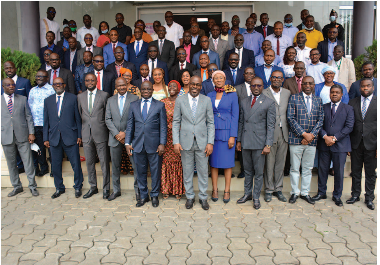
Photo de famille du management et du personnel de PETROCI Family photo of PETROCI management and staff

Le lancement de la production est prévu au deuxième trimestre 2023 avec un débit moyen de 12 000 barils/jour de pétrole brut et de 17,5 millions de pieds cubes/jour de gaz naturel associé.