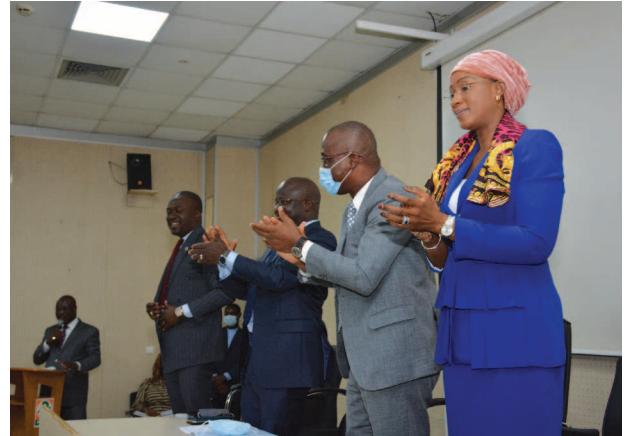
Standing ovation du personnel et du management à l'annonce de la découverte Standing ovation from staff and management at the announcement of the discovery

pétrole brut et le gaz naturel associés, la Côte d'Ivoire va gagner un accroissement de ses réserves prouvées de pétrole et de son patrimoine énergétique.