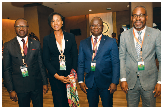
Le management de PETROCI au Séminaire interne du MMPE

des populations. « Mon administration sera à l'écoute du secteur privé, créateur de richesses, pour stimuler, accompagner et encadrer ses activités. Les sociétés d'Etat sous tutelle devront s'approprier les dispositions de la loi n 2020-626- du 14 août 2020 portant définition et organisation des sociétés d'Etat, relatives à l'exercice de la tutelle. En particulier, leurs orientations stratégiques devront être cohérentes avec les stratégies sectorielles définies par l'Etat », a-t-il ajouté, avant de préciser que les communications seront faites en temps