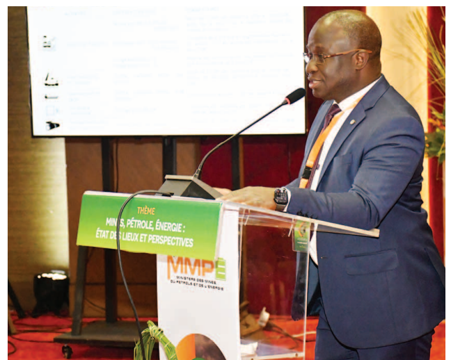
M. Vamissa Bamba Directeur général de PETROCI lors de sa présentation

Après la cérémonie d'ouverture et les travaux thématiques (Mines, Énergie et Hydrocarbures), ce séminaire a été marqué à la fin, par une adresse du ministre. Tout en informant que la synthèse des travaux sera d'un apport significatif dans l'élaboration de la feuille de route de l'action commune de son ministère, Sangafowa Coulibaly a dit noter la volonté de tous d'œuvrer avec détermination à l'accélération du développement des secteurs des mines, du pétrole et de l'énergie, en vue d'une participation plus effective à la transformation structurelle de l'économie ivoirienne. Conscient que des enjeux sociaux, environnementaux, sécuritaires et financiers importants constituent des menaces certaines, liées à la fois à l'environnement international en constante évolution et à des contraintes endogènes, le ministre a mis en avant la bonne gestion de ces risques qui sera un gage de succès au bénéfice